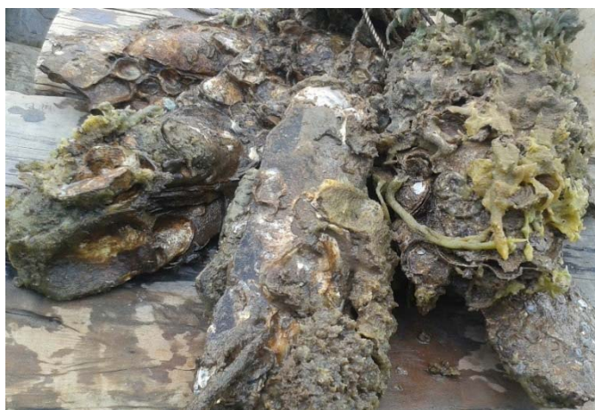
Hình 3: Các loại sinh vật bám và những loài hàu không có giá trị kinh tế cùng bám trên giá thể nuôi hàu tại tỉnh Bến Tre

Việc vệ sinh cho hàu được thực hiện hàng tháng hoặc 2 tháng một lần tùy theo các hộ khảo sát, máy bơm được sử dụng để rửa sạch phù sa và vật chất hữu cơ lắng đọng trên vỏ hàu. Do đặc điểm cấu tạo cơ thể hàu không có chân do đó chúng không thể di chuyển và cũng không có khả năng tự làm sạch vật chất hữu cơ và sinh vật bám trên vỏ. Việc định kỳ vệ sinh rửa vỏ hàu sẽ giúp hàu có khả năng tiếp xúc với dòng nước tốt hơn để lọc thức ăn và hấp thu khí ô-xy phục vụ cho quá trình sinh trưởng. Mặt khác, việc rửa vỏ hàu cũng làm tăng giá trị thẩm mỹ của sản phẩm, phòng tránh sinh vật bám gây hại vỏ và sản phẩm có thể được tiêu thụ dễ dàng hơn khi đến thời gian thu hoạch.