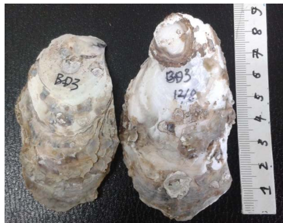
Hình 1: Hàu C. belcheri được nuôi tại Bến Tre

Loài: Crassostrea belcheri (Sowerby, 1871)