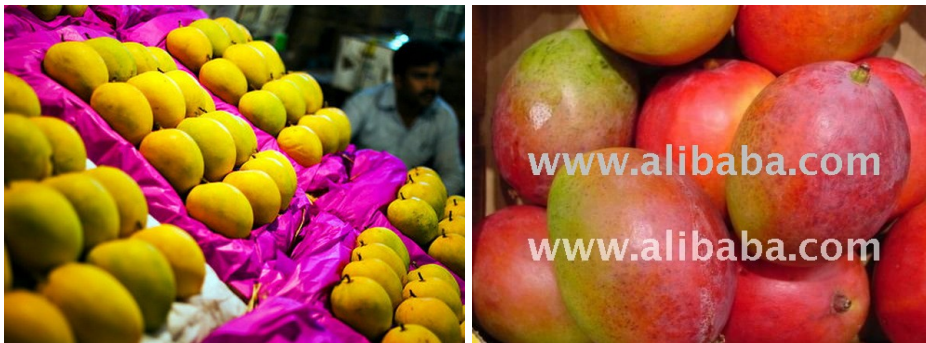
Hình 1: Xoài Alphonso của Ấn Độ và xoài Tommy của Mexico

Ấn Độ là Vua xoài của thế giới với hơn 30 giống xoài khác nhau. Giống xoài được cả thế giới biết đến là Alphonso có cỡ trái trung bình, hình trứng và màu vàng cam, thịt xoài khô ráo, chắc thịt và không có xơ; xoài Kent, Tommy Atkins của Mexico cũng có chất lượng tương tự nhưng màu đỏ cam (Hình 1). Đây là những điều mà xoài ở Việt Nam nói chung và ĐBSCL nói riêng chưa thực hiện được, đặc biệt là các đặc tính thỏa mãn thị hiếu của người tiêu dùng như xoài của Ấn Độ liên quan đến rãi vụn, kích cỡ, khô ráo khi ăn, vỏ dày bảo đảm khi vận chuyển, lột vỏ dễ dàng khi ăn (không cần dao) và cải tạo giống mới liên tục theo yêu cầu người tiêu dùng.